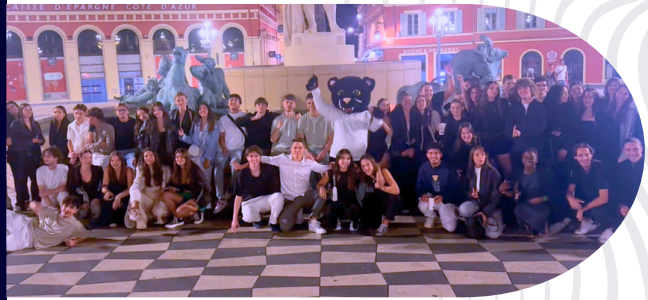
Soirée d'intégration des étudiants

Créé en 1998, le BDE Droit Nice est une association étudiante œuvrant pour les étudiants de la faculté de Droit et Science Politique de Nice, en organisant des événements festifs, culturels et académiques afin d'animer et d'améliorer la vie étudiante sur le campus Trotabas.