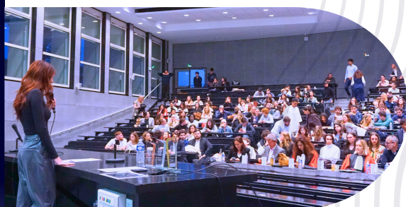
Concours d'éloquence Nikaïa par le BDE Droit Nice