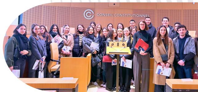
Voyage à Paris avec les étudiants